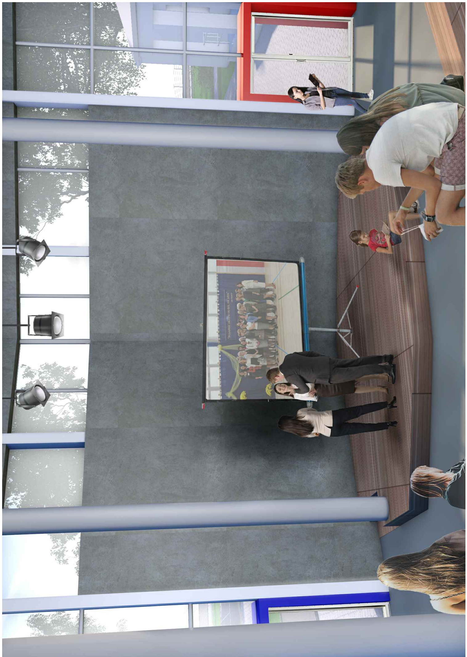
WIZUALIZACJA NR 6